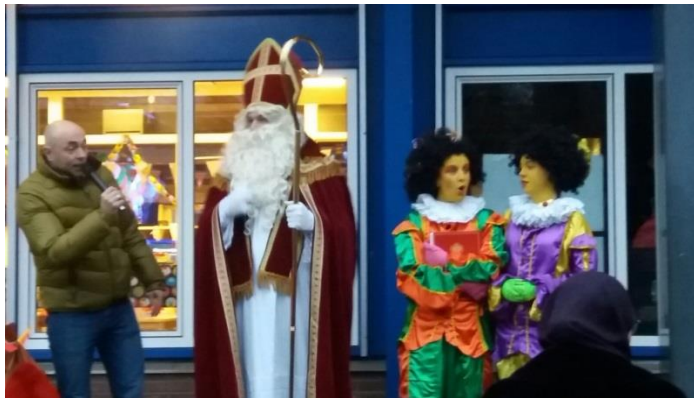
Meester Klaas heet de Sint welkom