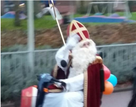
De aankomst van Sinterklaas

Op 5 december stonden de kinderen van onze school vol verwachting op het schoolplein te wachten op Sinterklaas en zijn Pieten. En, jawel, ook dit jaar kwam hij naar obs Holendrecht om de kinderen een cadeautje te geven en er een mooi feest van te maken! Helaas was zijn schimmel ziek achter gebleven en kwam Sinterklaas op een heuse scootmobiel onder luid gezang van de kinderen aan. Het werd een geweldige dag!